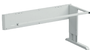
Concept marco de extensión