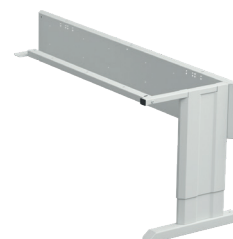
Concept marco para esquina