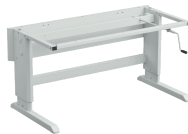
Concept ajustable con manivela